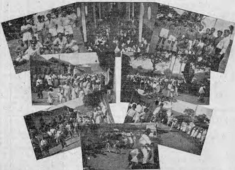
Parte superior de izquierda a derecha: el equipo del "Alajuela Junior"; un aspecto de la iglesia de Nicoya, durante una misa de gala; equipo de fútbol nicoyano.—Centro: izquierda, un aspecto de la procesion de San Blas, patrón de Nicoya; derecha, una alegre cabalgata durante uno de los dias de fiestas cívicas.—Parte inferior: izquierda, otro aspecto de la procesion en honor de San Blas; los toros recorriendo en paseo las principales calles de la poblacion; otro aspecto de la procesion